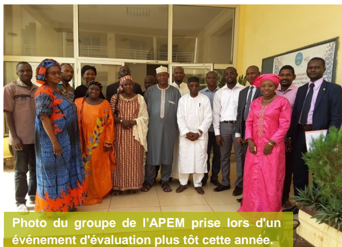
Photo du groupe de l'APEM prise lors d'un événement d'évaluation plus tôt cette année.

Dans la troisième semaine du mois de juin APEM a organisé des séances préparatoires de sa participation au dixième symposium Malien sur les sciences appliquées (MSAS) 2018 qui se tiendra du 22 au 27 juillet à Bamako. La présentation de l'APEM portera sur les deux thèmes retenus qui sont les suivants :