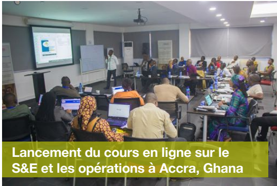
Lancement du cours en ligne sur le S&E et les opérations à Accra, Ghana