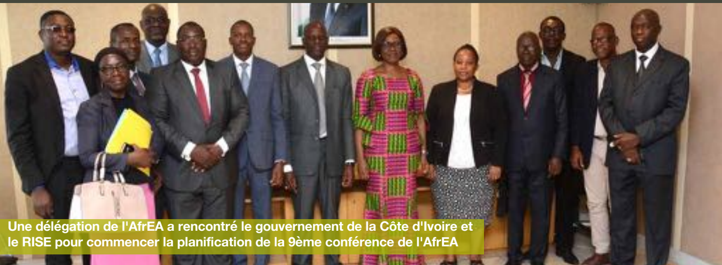
Une délégation de l'AfrEA a rencontré le gouvernement de la Côte d'Ivoire et le RISE pour commencer la planification de la 9ème conférence de l'AfrEA

Les préparatifs de la 9ème conférence sont déjà en cours.