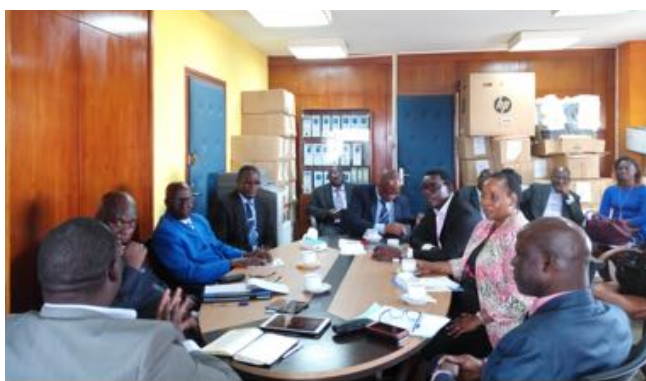
February 19, 2019 – Le 19 Février, séance de travail avec le DG du Plan du Ministère du Plan et du Développement