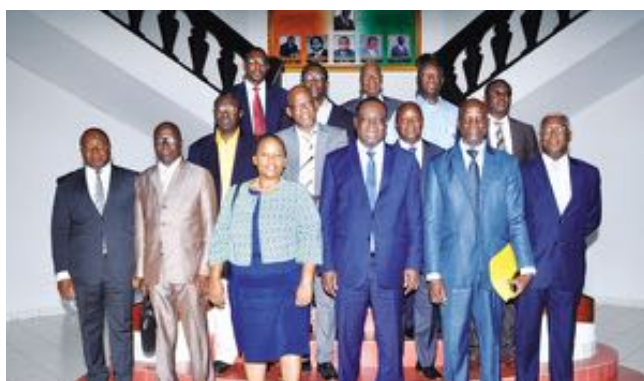
February 22, 2019 – L'inspecteur général d'Etat, Théophile Ahoua N'Doli a échangé hier, avec les membres du Réseau Ivoirien du Suivi et de L'Évaluation (RISE) et de L'African Evaluation Association (AfrEA), à son cabinet au Plateau.